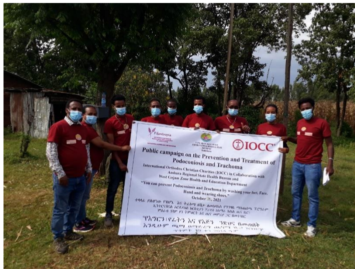
Paikallisia nuoria koulutetaan viestinviejiksi.

Sairaudet ovat erityisen vammauttavia naisille, koska naisten pääsy terveydenhoidon piiriin on heikkoa. Podokoniosis johtaa puolestaan usein siihen, että puoliso hylkää sairastuneen naisen. Sairaus ei tartu ihmisestä toiseen vaan johtuu maaperästä aiheutuvasta ärsytyksestä.