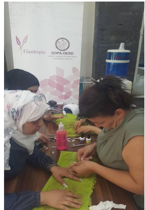
Naisten voimaantumista tuetaan monella tavalla.

Syyrian hankkeen kokonaiskulut toimintavuonna ovat 129 500 euroa, josta toiminto-, käyttö-, työntekijä- ja seurantakuluihin Syyriassa on varattu 103 550 euroa ja viestintä-, työntekijä-, vapaaehtois- ja tukitoimien kuluihin kotimaassa 25 950 euroa. Ulkoministeriön tuki kattaa kuluista 85 % ja Filantropia vastaa 15 % omavastuusuudesta.